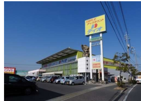
ディオ岡山西店 徒歩9分