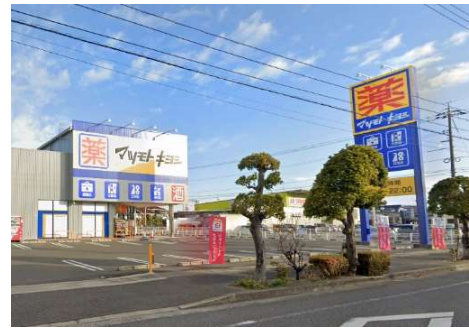
マツモトキヨシ岡山平田店 徒歩9分