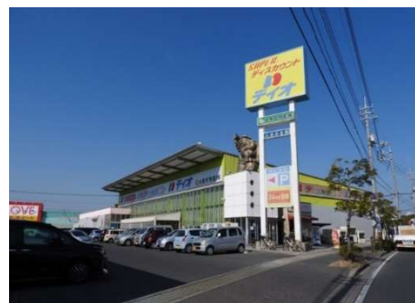
ディオ岡山西店 徒歩9分