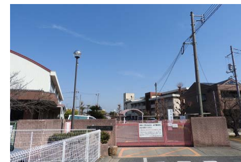
芳明小学校 徒歩12分