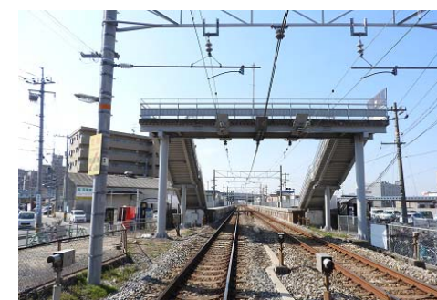
JR備前西市駅 徒歩17分