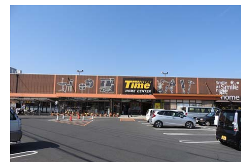
ホームセンタータイム 徒歩10分