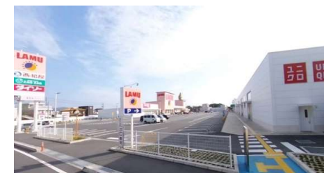
ラ・ムータウン岡山中央店 徒歩6分