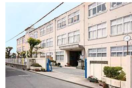
御野小学校 徒歩10分