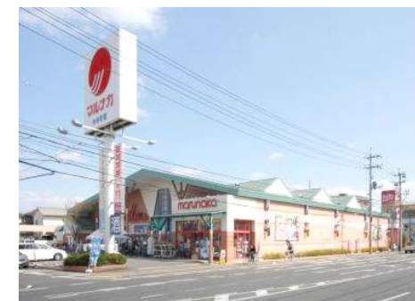
山陽マルナカ中井町店 徒歩13分