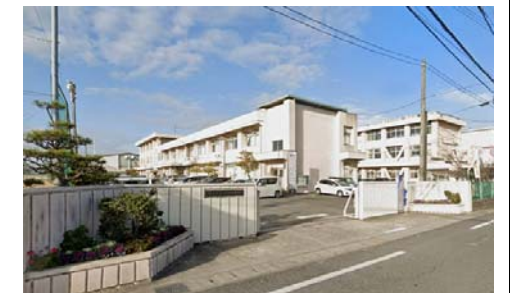
御南中学校 徒歩18分