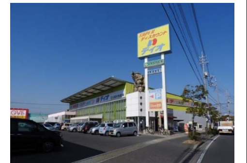
ディオ岡山西店 徒歩9分