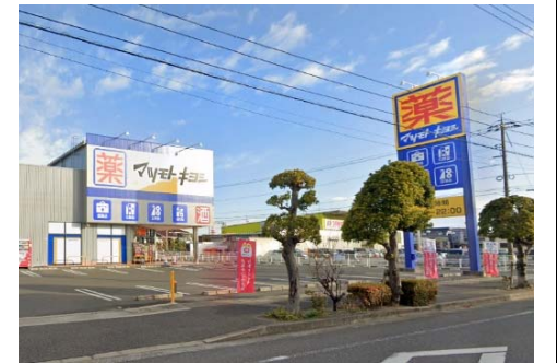
マツモトキヨシ岡山平田店 徒歩9分