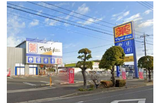
マツモトキヨシ岡山平田店 徒歩9分