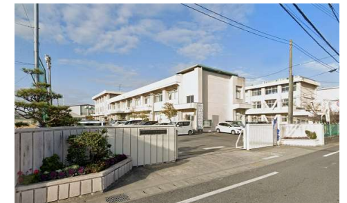
御南中学校 徒歩18分