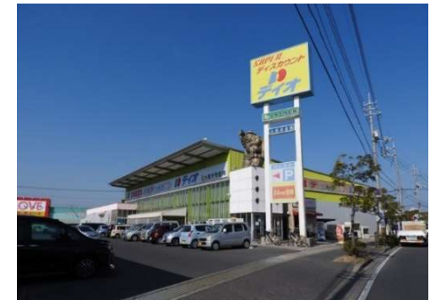
ディオ岡山西店 徒歩9分