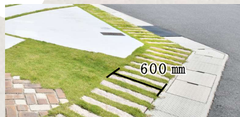
グリーンゾーン (600mm 延べ石+芝生)