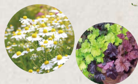
シンボルツリー・植栽イメージ