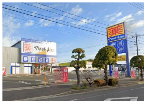
マツモトキヨシ岡山平田店 徒歩9分