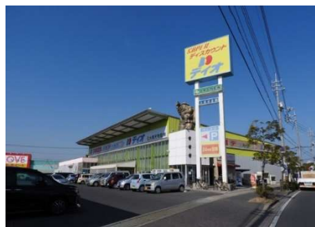
ディオ岡山西店 徒歩9分