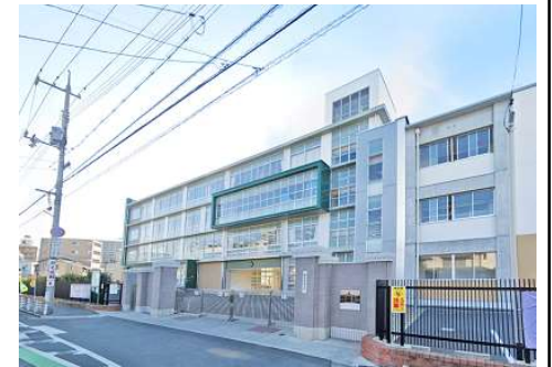
鹿田小学校 徒歩10分