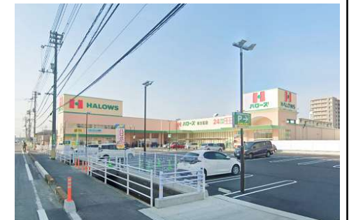
ハローズ 東古松店 徒歩7分