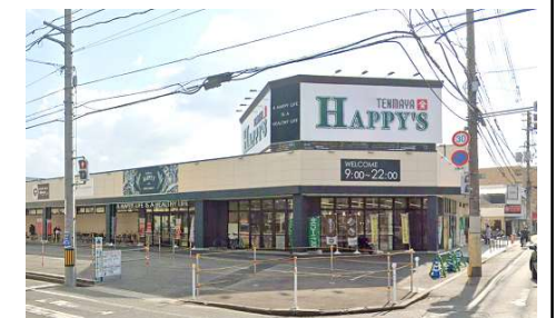
天満屋ハピーズ岡輝店 徒歩8分