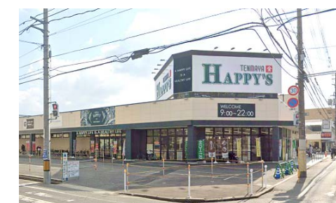
天満屋ハッピーズ岡輝店 徒歩8分