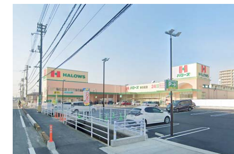
ハローズ 東古松店 徒歩7分