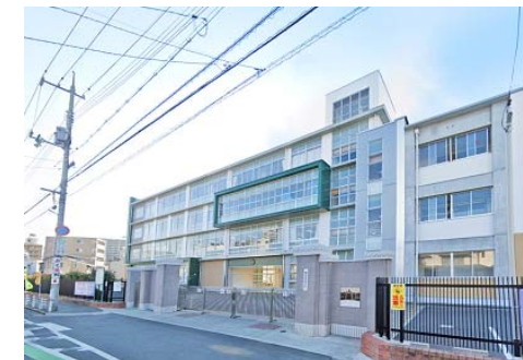
鹿田小学校 徒歩10分