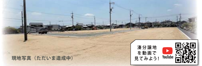
現地写真(ただいま造成中)