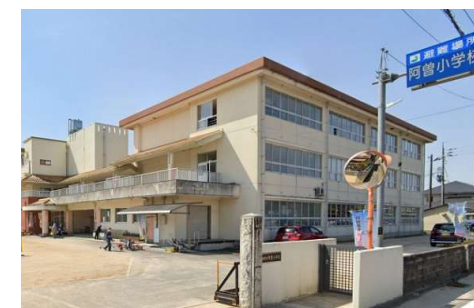
阿曾小学校 徒歩1分