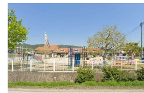
阿曾幼稚園 徒歩2分