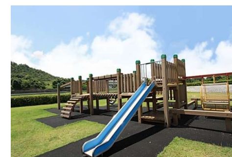
松ヶ鼻ファミリーパーク 徒歩9分