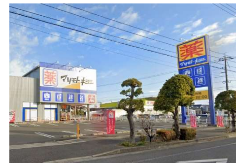
マツモトキヨシ岡山平田店 徒歩9分