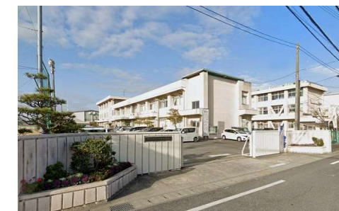
御南中学校 徒歩11分