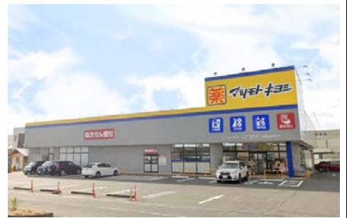
マツモトキヨシ田中店 徒歩4分