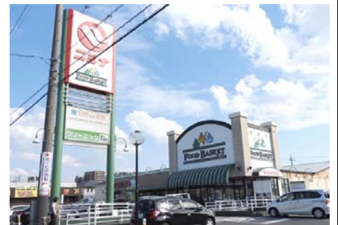
ニシナフードバスケット 中山道店 徒歩4分