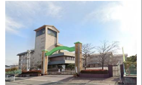
御南小学校 徒歩14分