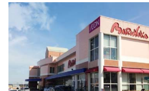
山陽マルナカ平井店 徒歩17分