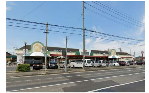
ニシナ水島北店 徒歩11分