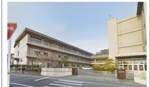
第二福田小学校 徒歩8分