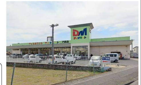
デオマート北畝店 徒歩13分