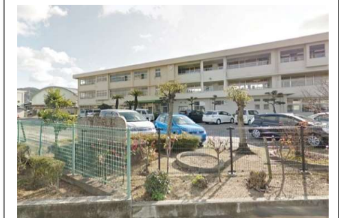
福田中学校 徒歩21分