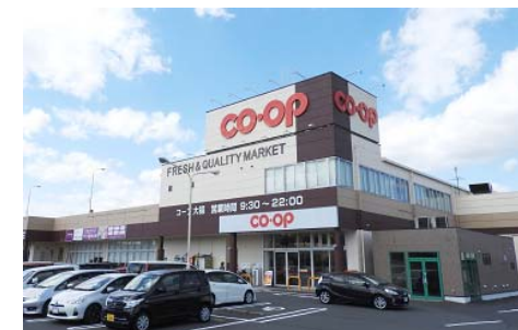
コープ大福 徒歩5分