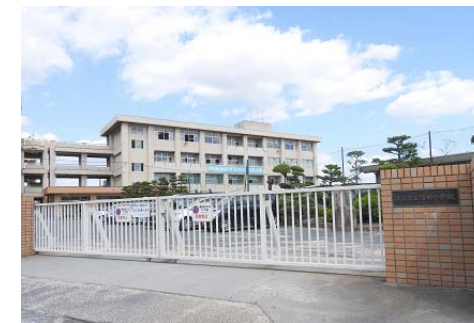
福田小学校 徒歩18分