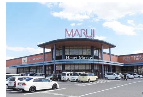
マルイ大福店 徒歩7分