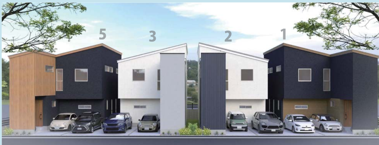
※建物ご提案プラン北面外観イメージパース。現地に建物は建っていません。