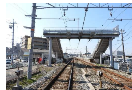
JR備前西市駅 徒歩11分