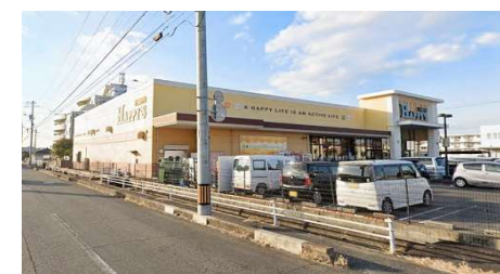
ハピーズ下中野店 徒歩3分