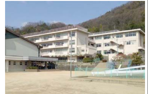
津島小学校 徒歩10分