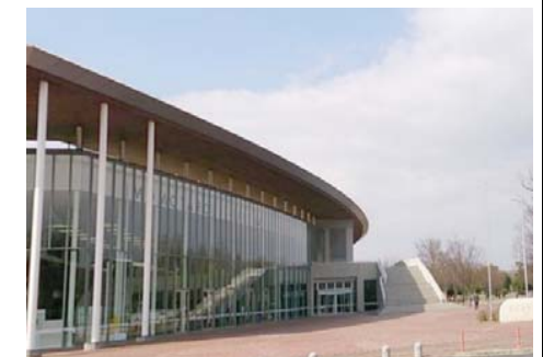
岡山県総合グラウンド 徒歩16分