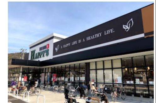
天満屋ハピーズ津島店 徒歩4分