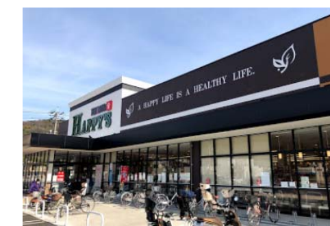
天満屋ハピーズ津島店 徒歩4分