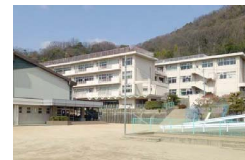
津島小学校 徒歩10分