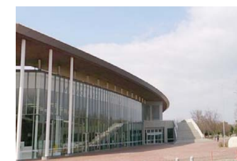
岡山県総合グラウンド 徒歩16分