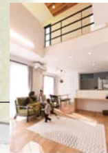
開放感のある吹き抜けリビング