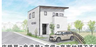
床暖房や食洗器も完備の充実仕様です!

土地+建物 販売価格 3,850万円 (税込) (※土地価格には、上下水道負担金550,000円、外構負担金623,563円を含みます。)