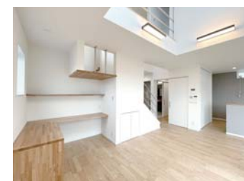
リビングの脇には、 スタディーカウンター