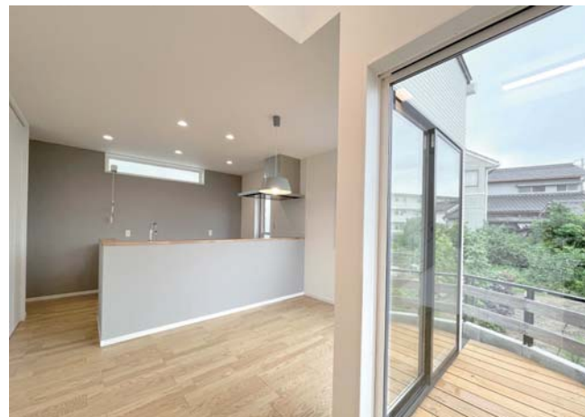
↑デッキに面した明るいダイニングキッチン