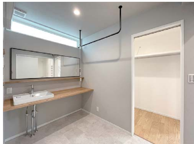
↑室内干しのできる洗面乾燥室の隣には、ファミリークローゼット！