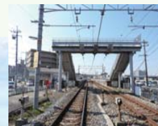
JR西市駅まで 徒歩約11分