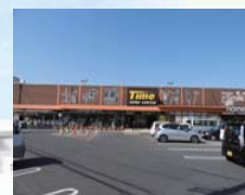
ホームセンタータイムまで 徒歩約6分