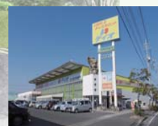
ディオ岡山西店まで 徒歩約11分