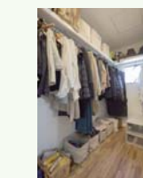
ウォークインクローゼット 完備で収納も楽々!