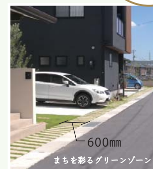
600mm まちを彩るグリーンゾーン