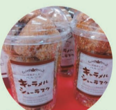
飲むジュレ、 金のシフォン、ほか 洋菓子工房ベルジェ