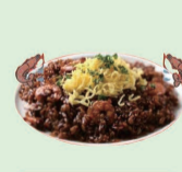
えびめし いさな家