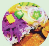
カレー 幸運町ニゴロカリー