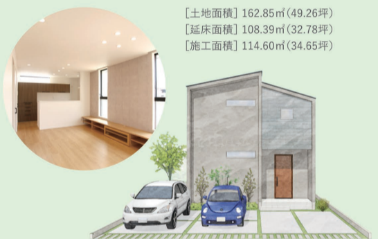
※外観は完成イメージです。

[土地面積] 162.85㎡ (49.26坪) [延床面積] 108.39㎡ (32.78坪) [施工面積] 114.60㎡ (34.65坪)