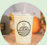
ドリンク more fruits モアフル