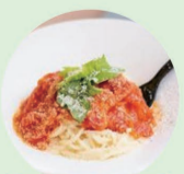
生パスタ a la maison アラメゾン