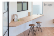
ホール～主寝室へウォーク スルーできる家事室。洗濯物 をここですぐにとめます。

川を眺めながらバーベキューが できるように敷地の形状を変更。板張りの 塀がプライバシーを守ります。