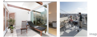
約16帖の広いバルコニーは使い方無限大。アウトドア ピングやバーベキュー空間など、家族で楽しんだりのんびり 過ごすのびのび空間。三方を田園に囲まれ景色がよく、周囲から 見えないよう目隠し、プライバシーにも配慮。

[土地面積] 142.04㎡ (42.96坪) [延床面積] 118.82㎡ (35.93坪) [施工面積] 150.70㎡ (45.57坪)