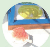
手づくりシロップ のカキ氷、ほか Rico