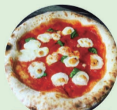
ピザ PIZZA cotarou