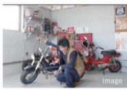
窓から愛車を眺めながら 日々の暮らしを楽しむ。

車とバイク、マウンテンバイクが好き。 そんなご主人のために、LDKから愛車を眺められる インナーガレージのある家。 ガレージ上部はゆったりとしたバルコニー。 家族でバーベキューやプチキャンプを楽しんだり… 何にしようか楽しみな。