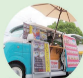
クレープ 36's Crepe