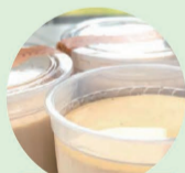
プリン プリン工房Lian

※飲食は有料です。※画像はイメージです。 ※数に限りがございますので、なくなり次第終了となります。