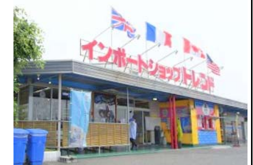
インポートショップトレンド 徒歩4分