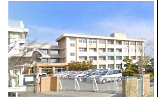
福田小学校 徒歩11分