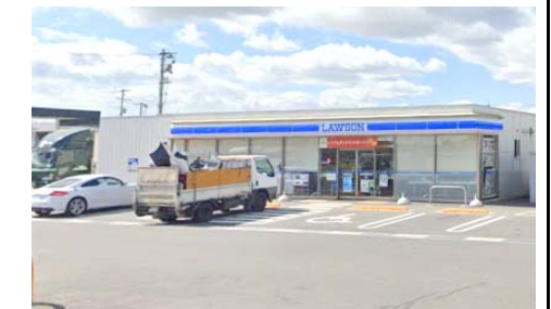
ローソン岡山古新田店 徒歩3分