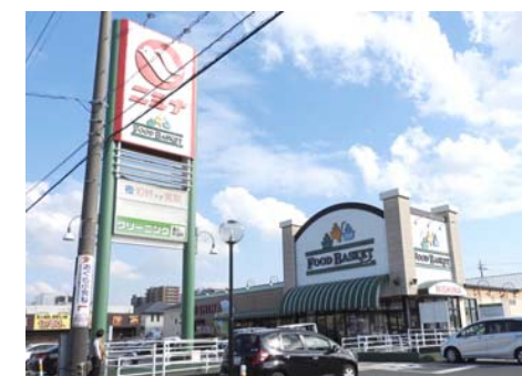
ニシナフードバスケット 徒歩14分