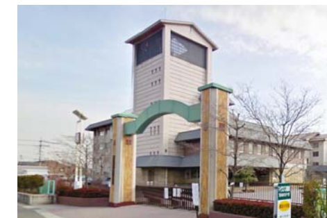
御南小学校 徒歩20分