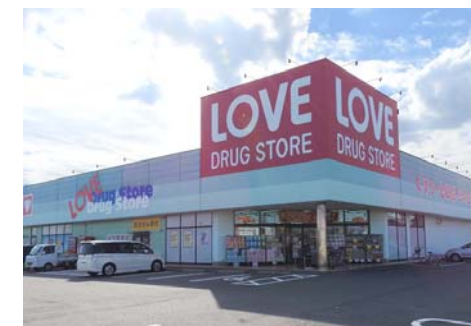
くすりのラブ田中店 徒歩8分