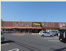
ホームセンタータイム 西市店まで 徒歩で約3分