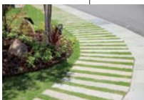
通りをつなぐ グリーンゾーン