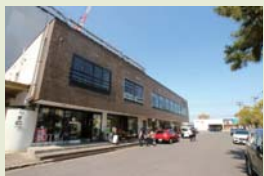
間屋町まで 自転車で約10分