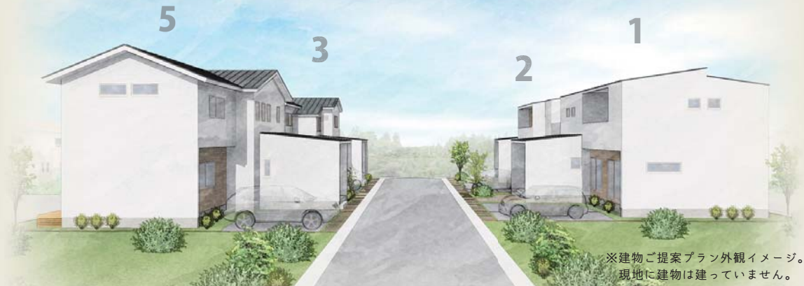
※建物ご提案プラン外観イメージ。現地に建物は建っていません。