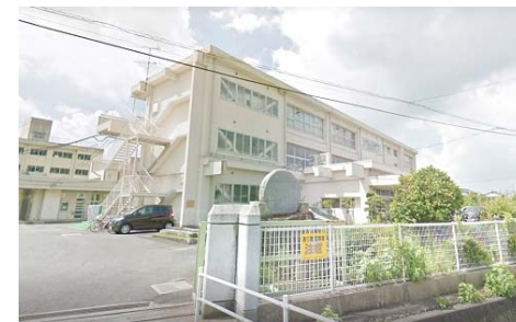
鯉山小学校 徒歩9分