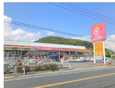
ジュンテンドー吉備津店 徒歩5分