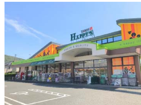
天満屋ハッピーズ 吉備津店 徒歩7分