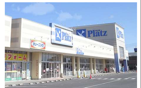
リョービプラッツ 徒歩9分