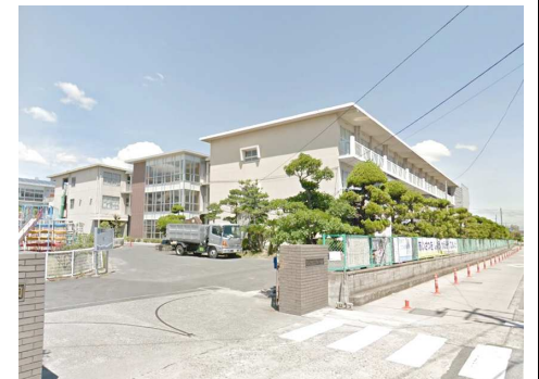
芳田小学校 徒歩11分