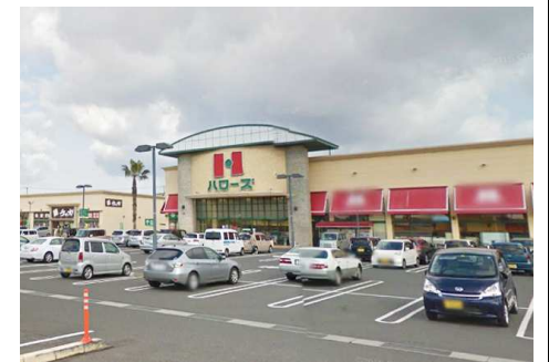
ハローズ当新田店 徒歩2分