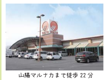
山陽マルナカまで徒歩22分