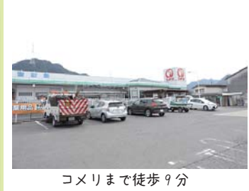
コメリまで徒歩9分