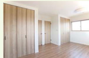
ライフスタイルの変化に合わせて間仕切り可能。