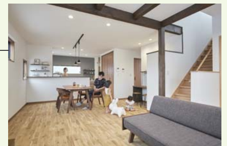
家族のようすを見守りながら家事ができるキッチンからダイニングキッチンを見渡せる間取り。