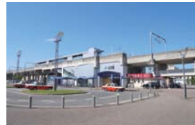
JR 大元駅まで 徒歩7分