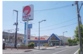
山陽マルナカ 大元店まで 徒歩7分