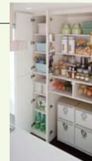
※写真はイメージです。実際の仕様とは異なります。