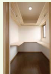
ウォークインクローゼットですっきり収納。