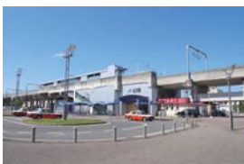
JR 大元駅まで 徒歩 7分