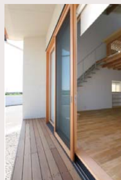
気密性も備えた考えた木製サッシ