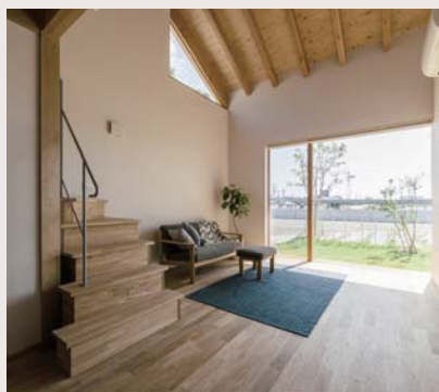
景色を美しく切りとる窓