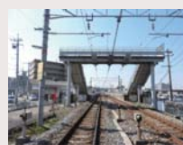
J R 西市駅まで 徒歩約 17分

●所在地/岡山市南区米倉150-8他●構造/木造2階建て●建築年月/2019年6月●地目/宅地●用途地域/第二種中高層住居地域●都市計画/市街化区域●建ぺい率/60%●容積率/200%●設備/水道、電気、浄化槽●接道/①~③号地:南西側7m、⑤⑥号地:南東側4m●備考/●学区/芳明小学校、芳田中学校●取引態様/売主