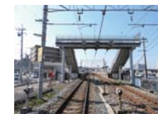
JR西市駅まで 徒歩約 17分