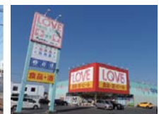
くすりのラブ 平田店 まで 徒歩約 13分