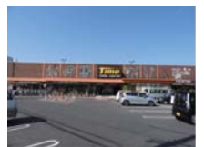
ホームセンタータイム まで 徒歩約 10分