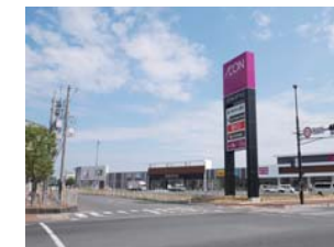
イオンスタイル岡山青江まで 徒歩 3分