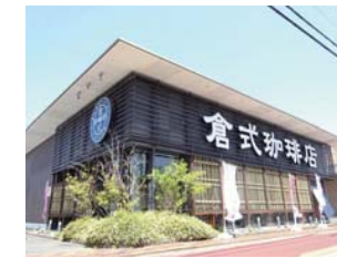
倉式珈琲店まで 徒歩 2分