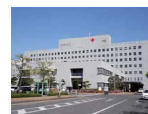
岡山赤十字病院まで 徒歩 6分