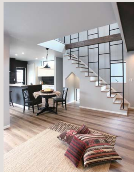
*「ソリッド」…硬い、密度がしっかりした物質・木材など

スチールやタイルなど無機質な素材とモノトーンの色合い。そして、重厚感のある梁やオーク柄の床で構成された室内に、ボヘミアンスタイルの小物をちりばめることで、味わい深い空間に。