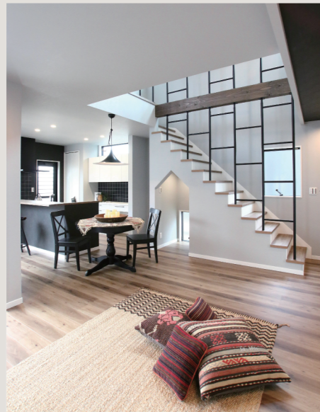
*「ソリッド」・・・硬い、密度がしっかりした物質・木材など

スチールやタイルなど無機質な素材とモノトーンの色合い。そして、重厚感のある梁やオーク柄の床で構成された室内に、ボヘミアンスタイルの小物をちりばめることで、味わい深い空間に。