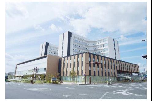
岡山市立市民病院 徒歩8分