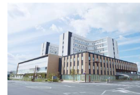
岡山市立市民病院 徒歩8分