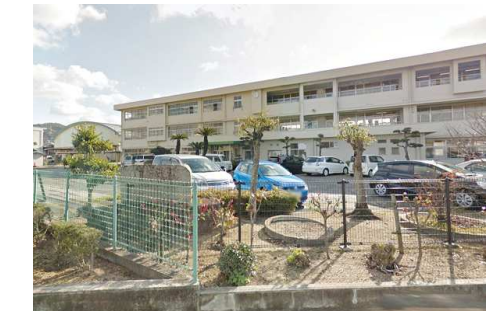
福田中学校 徒歩4分