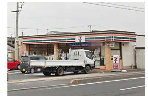
セブンイレブン倉敷福田町南店 徒歩1分