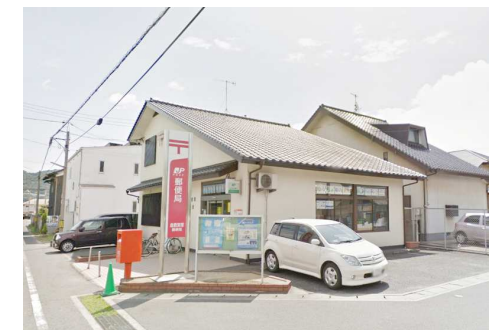
倉敷東塚郵便局 徒歩3分