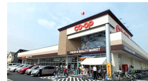
コープ大福 徒歩12分