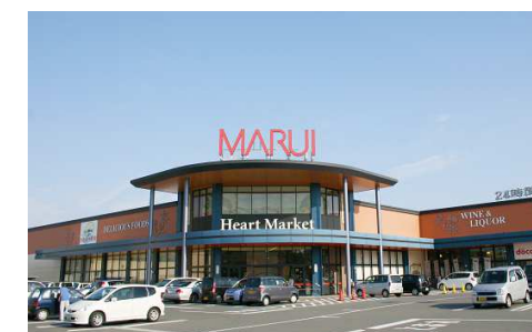
マルイ大福店 徒歩10分