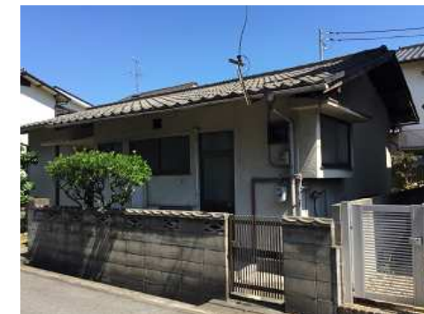
現地写真(更地渡し)