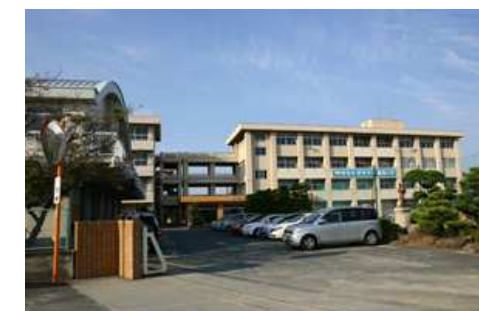
福田小学校 徒歩20分