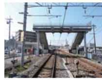
J R 西市駅まで 徒歩約 17 分