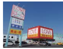
くすりのラブ 平田店 まで 徒歩約 13 分