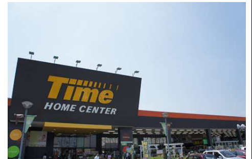
ホームセンタータイム徒歩10分