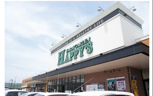
天満屋ハピーズ 徒歩9分