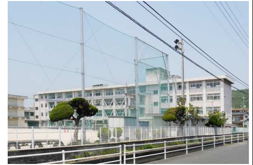
大野小学校 徒歩7分