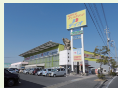
ディオ岡山西店まで 徒歩約 11分