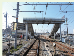
J R 西市駅まで 徒歩約 11分