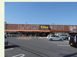
ホームセンタータイムまで 徒歩約 6分