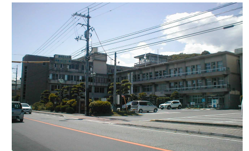
備前市役所 徒歩3分