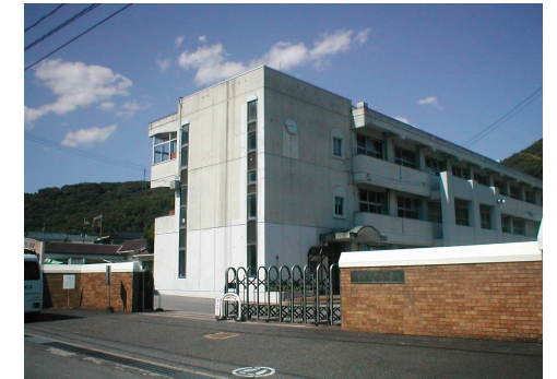
片上 小学校 徒歩15分