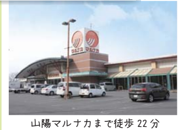
山陽マルナカまで徒歩22分