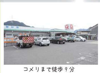
コメリまで徒歩9分