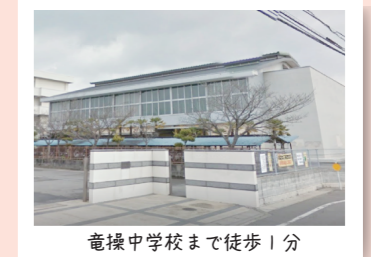
竜操中学校まで徒歩1分