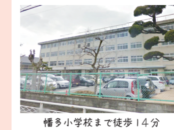
幡多小学校まで徒歩14分