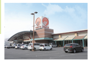
山陽マルナカまで徒歩22分