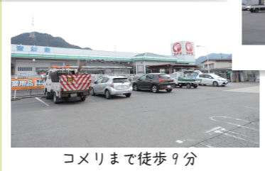
コメリまで徒歩9分